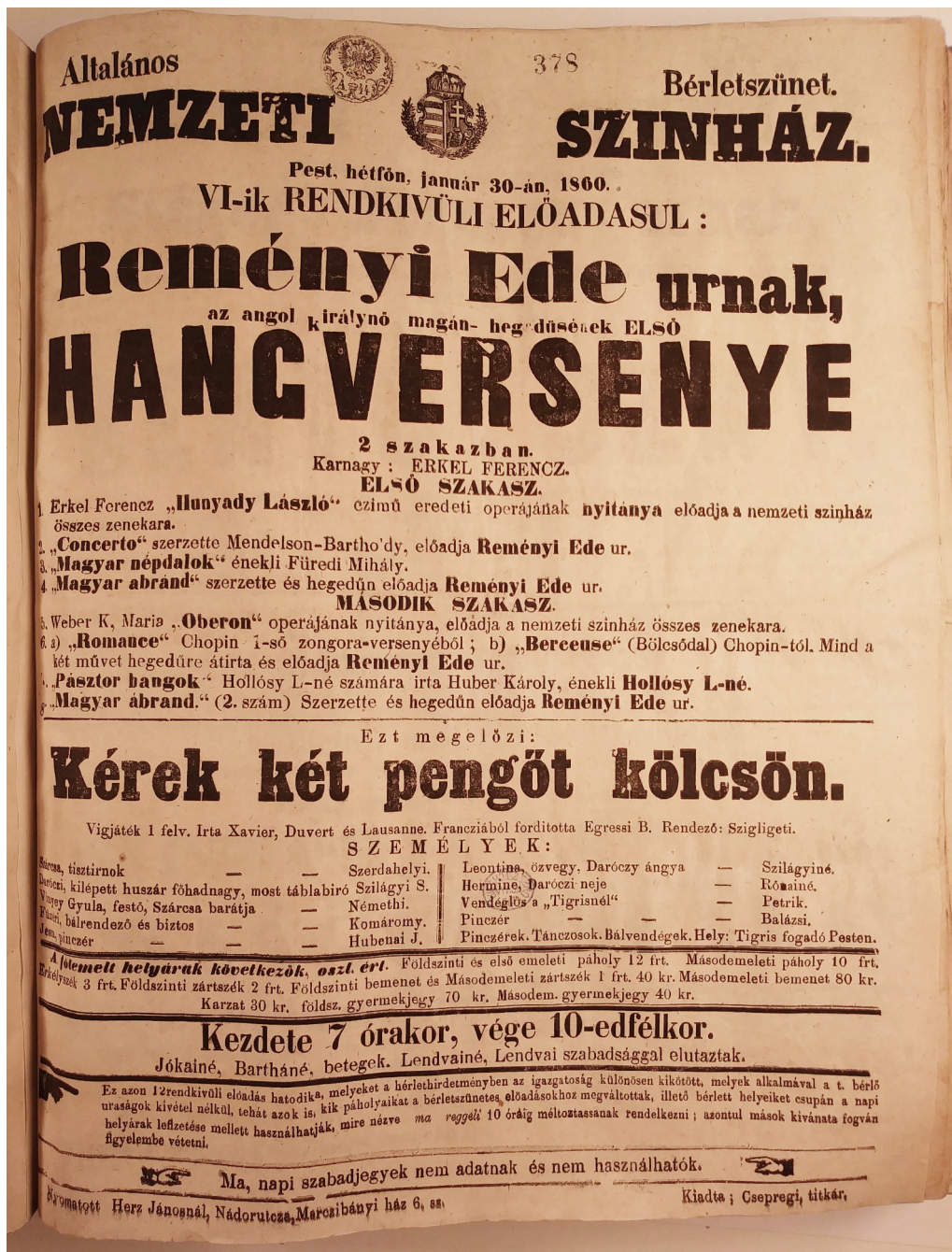
1. Reményi Ede első hangversenye, Nemzeti Színház, 1860. január 30.